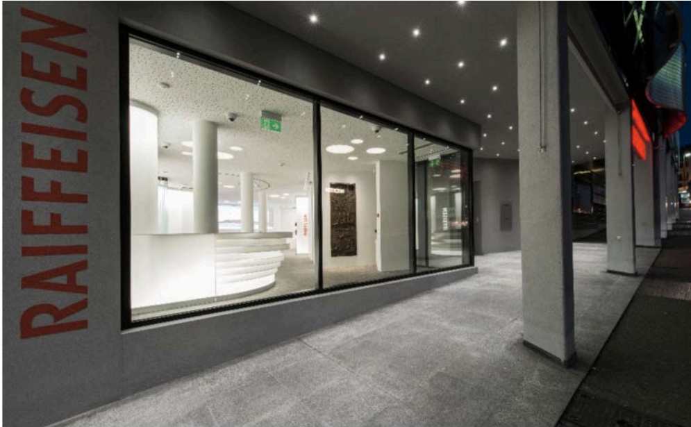
B Light per la Banca Raiffeisen a Mendrisio

Laris , apparecchio architettonico da incasso dimmerabile, è stato installato sia nel portico esterno che nelle aree interne, ad apposite distanze: la sua luce, in grado di garantire un effetto luminoso ideale per valorizzare piccole nicchie e oggetti, ha consentito di creare lungo le pareti curve la medesima quantità di luce generata da Linear Tube HP 6 Wall.