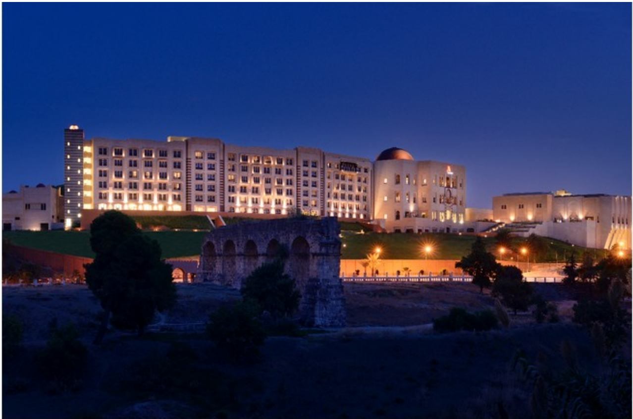
Hotel Marriott Constatine in Algeria

Per illuminare in radenza le ampie facciate esterne dell'edificio, creando un gioco di luci e ombre con le sporgenze e le rientranze architettoniche, e con le curve delle finestre ad arco a ferro di cavallo, sono stati applicati i proiettori dal design sobrio e pulito Maia X1 Duo (customizzati con biemissione di luce up and down sulle facciate esterne) e Maia X2 Duo . A tali proiettori è stato affiancato, inoltre, un apparecchio dal design minimale per installazione da parete: Okkio 55W . Per sottolineare l'interno della maestosa volta, che sormonta le confortevoli zone comuni, è stato installato Linear Tube hp Wall , un apparecchio lineare modulare dall'elevato flusso luminoso, in grado di fornire un effetto lavaggio della parete; in questo caso, è stato montato in versione custom pilotata in Dali.