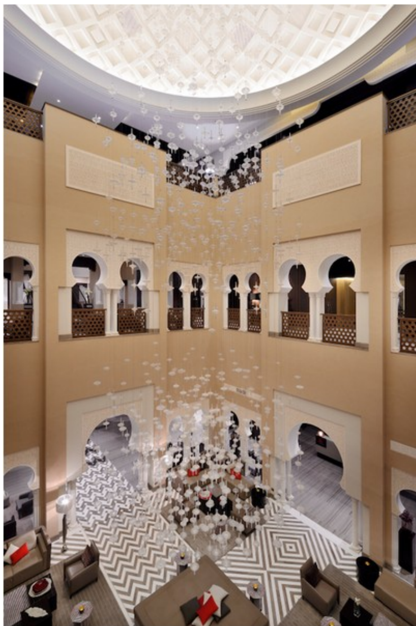
Hotel Marriott Constantine in Algeria

Inoltre, grazie alla discreta ma efficace presenza di Inside 60 sq, apparecchio quadrato minimale perfetto per l'incasso a soffitto a cartongesso e dal minimo impatto visivo, le zone comuni hanno potuto beneficiare di un'integrazione totale dell'impianto d'illuminazione con l'architettura. Infine, la piscina coperta, caratterizzata da uno stile che richiama l'architettura locale algerina, è stata illuminata con Inserto Mini CI , elemento lineare compatto, modulare e dimmerabile, distribuito in modo perfettamente omogeneo per valorizzare un luogo votato al relax e al benessere.