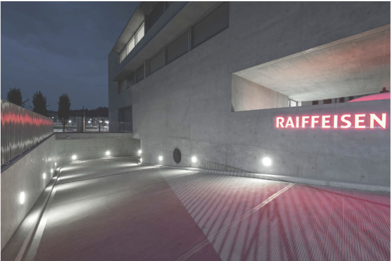
Button 200 W by B Light

I sorprendenti percorsi curvi delle scale interne sono evidenziati da Atlas XS R , apparecchio da incasso con ottica recessa, mentre i percorsi delle rampe esterne sono illuminate da prodotti della linea Button – Button 200 DO per la rampa pedonale e Button 200 W a parete per quella destinata al passaggio delle automobili – ideali per creare percorsi luminosi anche negli ambienti dal design più insolito. Per illuminare il giardino che decora l'esterno dell'edificio sono stati utilizzati apparecchi da incasso a pavimento della linea Merope , dimmerabili e orientabili. La tecnologia avanzata di B Light dona alla Banca Raiffeisen un'illuminazione in grado di seguire il design originale e le forme curve della struttura, valorizzandone il carattere futuristico e innovativo.